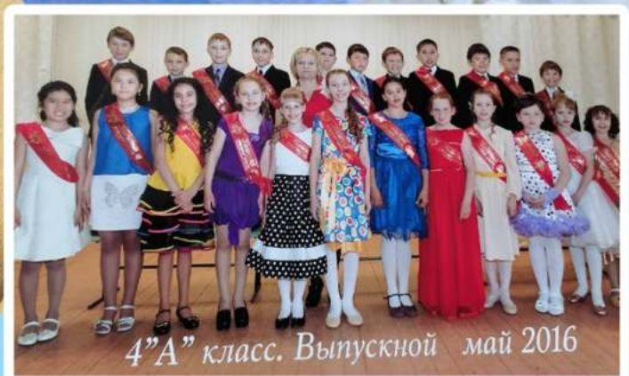
4"А" класс. Выпускной май 2016

Учеба - это большой труд. Чтобы хорошо учиться, нужно много трудиться, без этого никак!