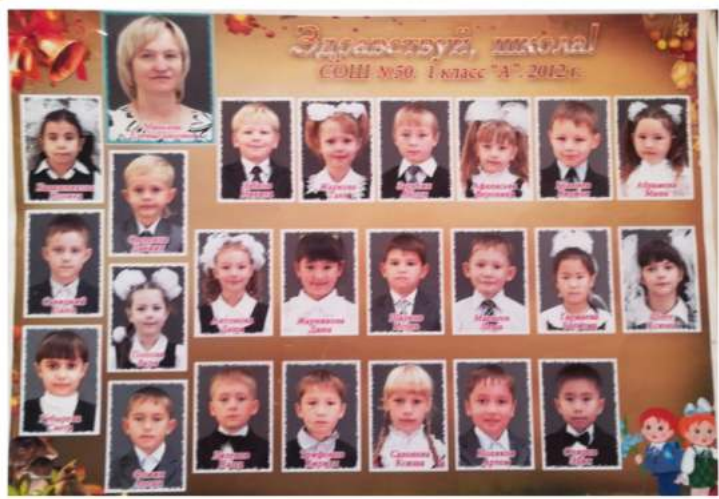
СОШ №50. 1 класс "А". 2012 г.