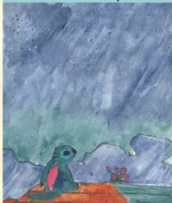
“Стуч” автор Ivain Lan

Продолжаем знакомить читателей с рисунками наших художников. Предлагаем два рисунка двух разных авторов.