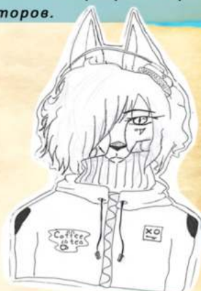
Персонаж “Фурия” автор идею Coffe tea.